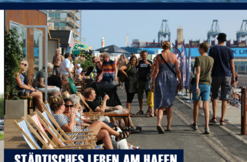
BERNHARDT JENSENS BOULEVARD