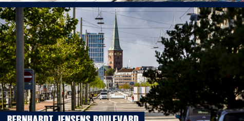
BERNHARDT JENSENS BOULEVARD