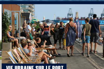
VIE URBAINE SUR LE PORT